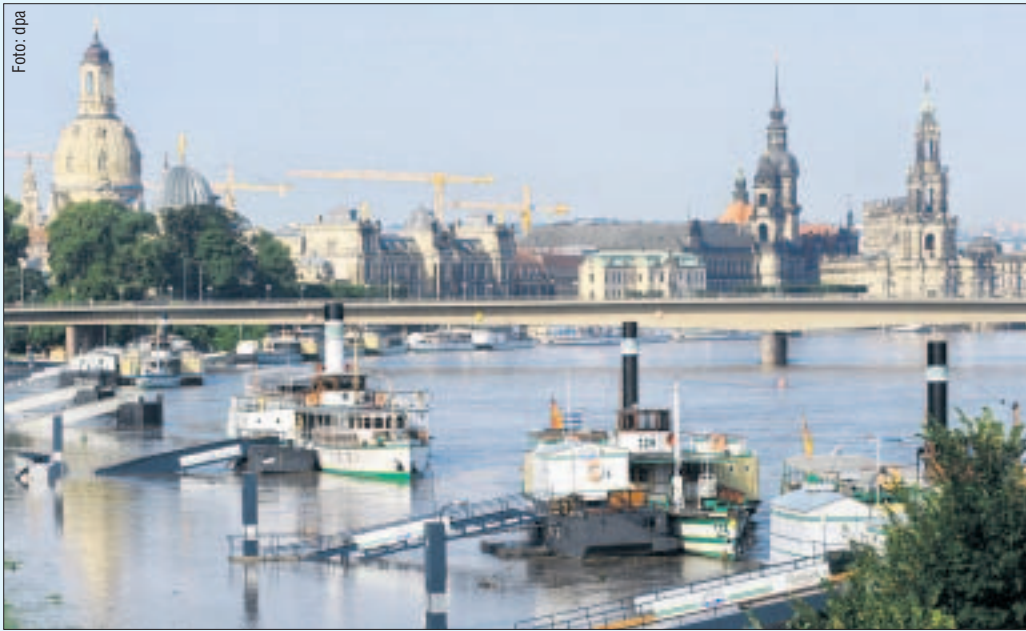
Das Wetter war nicht gut für den Flotten-Umsatz: Im August schwappte die Elbe über die Schiffsanleger.

Die Flottenparade zum Dampfschiff-Fest im August 2011 steht aber nach wie vor auf der Kippe (Morgenpost berichtete): „Wir haben in diesem Jahr sehr schlechte Erfahrungen gemacht“, erklärt Meyer-Stork. „Weil der Termin von der Stadt ständig verschoben wurde, mussten wir mehrfach an unsere Buchungskunden herantreten.“ Das sei eine unannehmliche Zumutung für die Fahrgäste gewesen. „Dieses Gezerre wollen wir nicht wiederholen.“